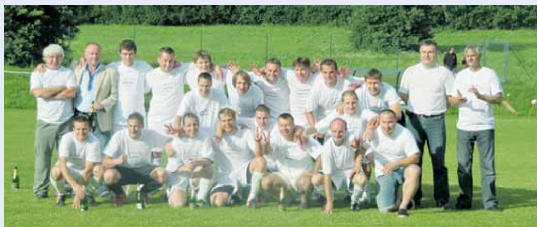
Muži Sokola Bořitov vybojovali historický postup do I.A třídy. V ní jsou po podzimu na devátém místě. * Vynikající druhá příčka patří staršímu dorostu FK APOS Blansko v divizi. Na snímku oslavy postupu z krajského přeboru.